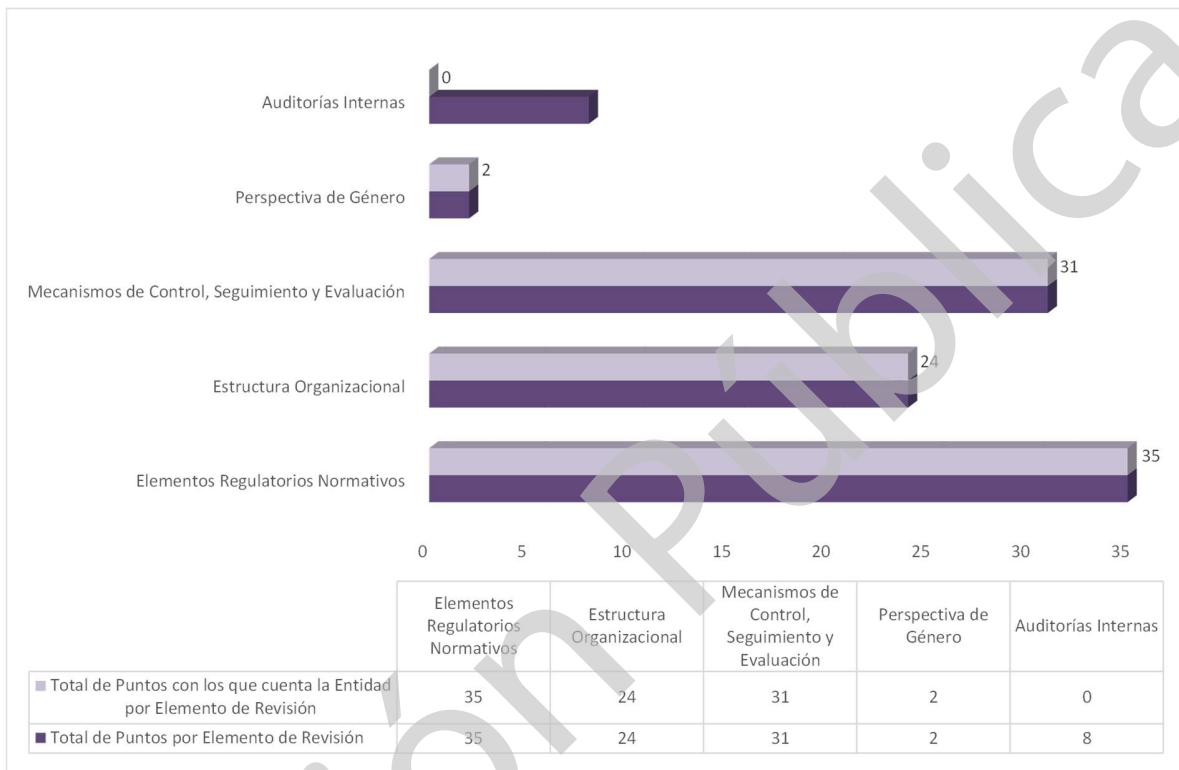
Grafica 1 Cumplimiento de los Mecanismos de Control Interno Ejercicio 2020